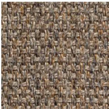
Quito - nuss | 084