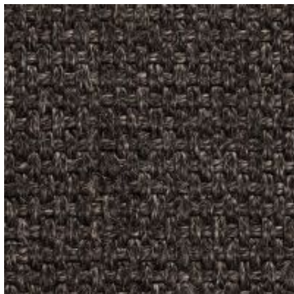
Quito - anthrazit | 044