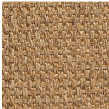
Quito - sand | 081