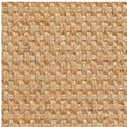
Quito - chablis | 007